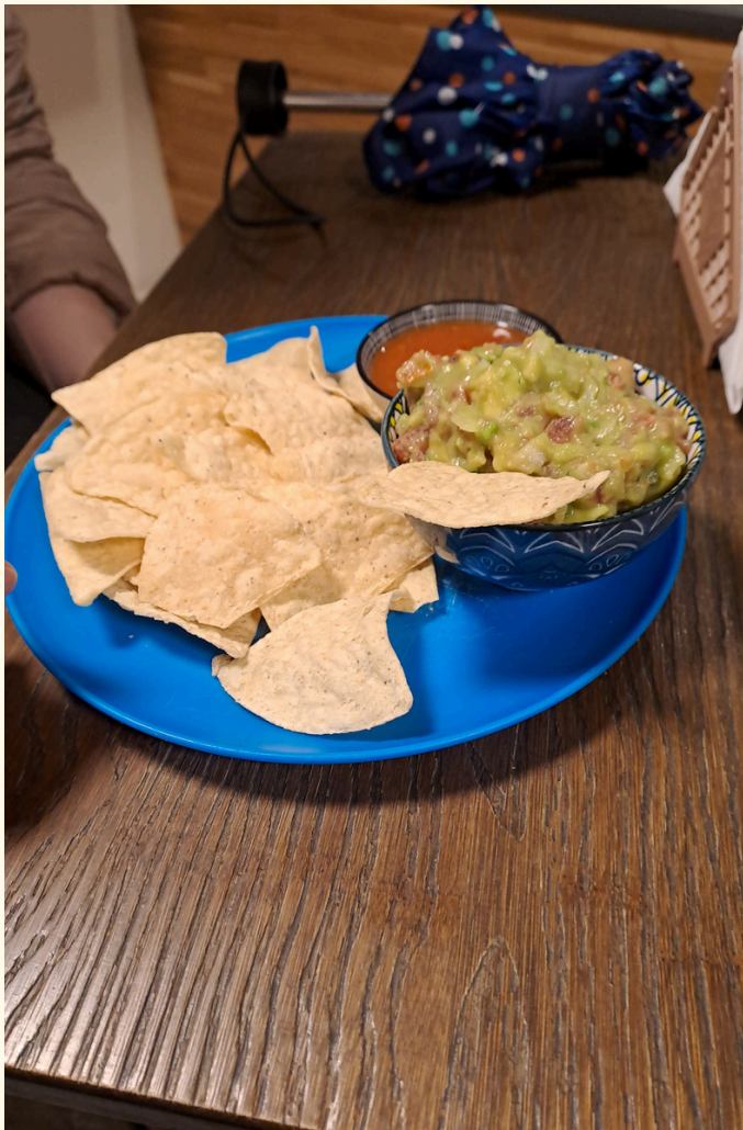
↓Nachos s guacamole z mexického bistra Chile y limón