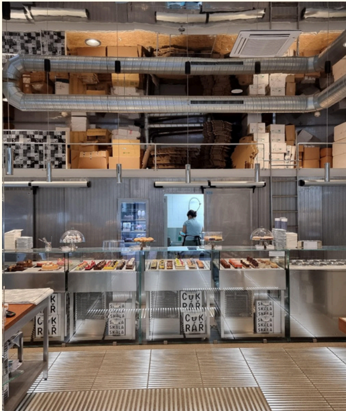
↑Interiér Cukrářství Skála nedaleko náměstí Republiky