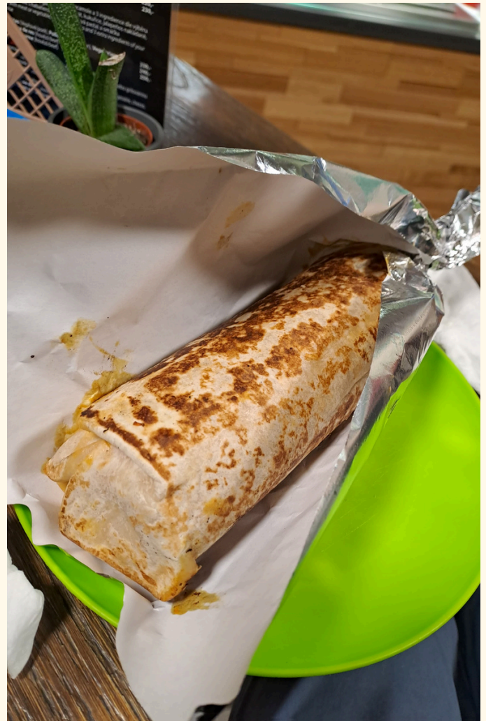
↓Mexické burrito nechybí v nabídce již zmiňovaného bistra